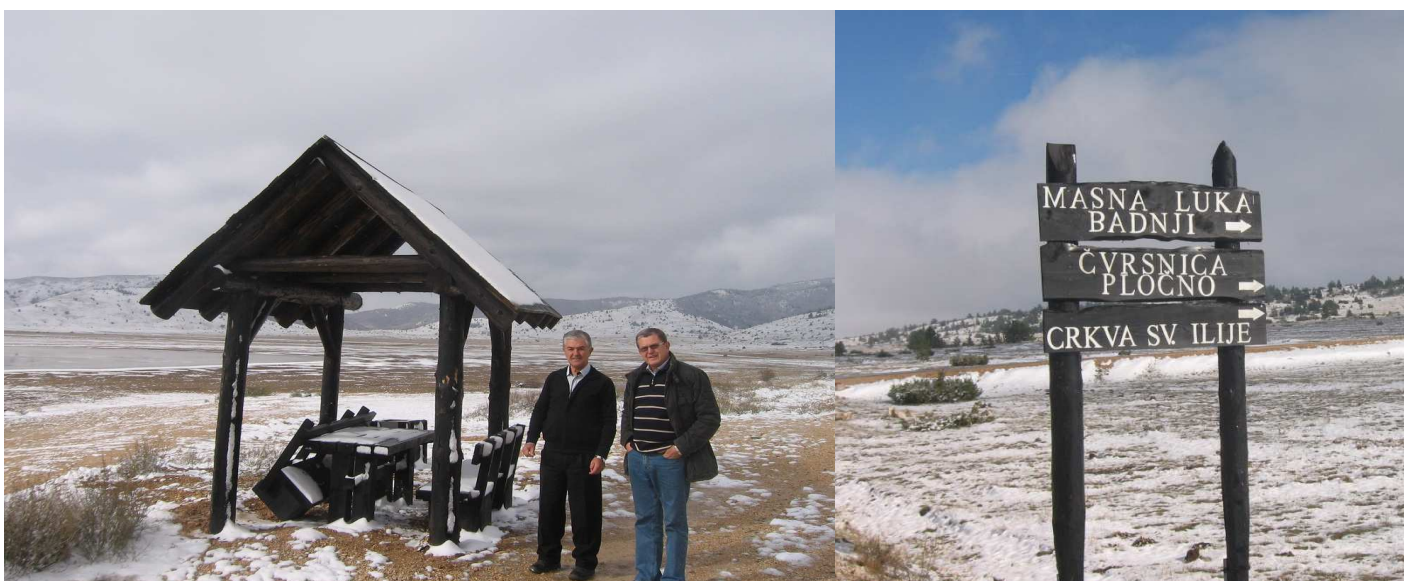
Izgrađeni mobilijar u PP Blidinje

Zbog konkurencije na tržištu BIH ugovori koji su planirani su ugovoreni za niže cijene, tako da je preostao dio sredstava veći od planiranog za ostale aktivnosti. Uz odobrenje Svjetske Banke sve će se realizovati u za zaštićena područja Očekujemo realizaciju plaćanja svih aktivnosti do kraja, tj do zatvaranja projekta : 31. Oktobra 2013. God.