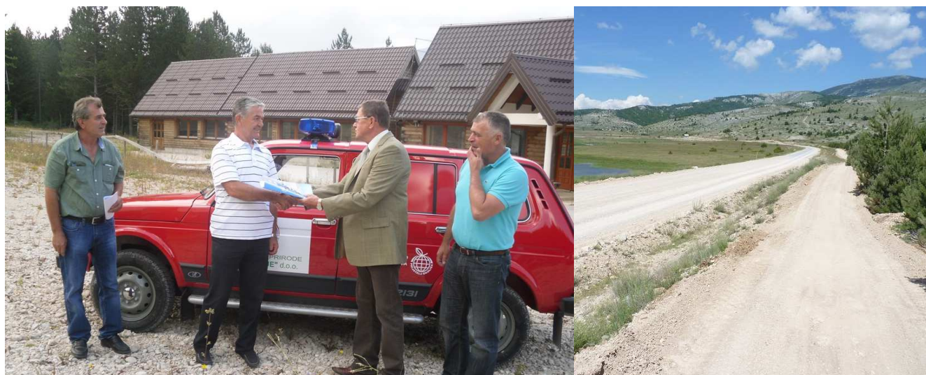
Primopredaja vatrogasnog vozila i izgrađena biciklistička staza u PP Blidinje